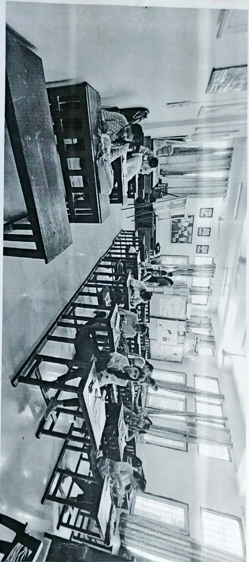
Rakburg Makay Competition organised on 28-8-23